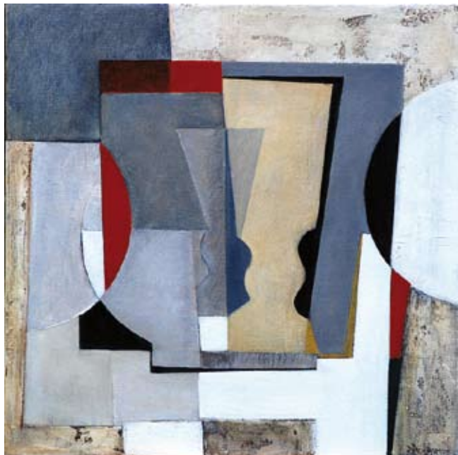
Glasses overlapping, 40x40 cm, € 1100,-