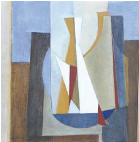
Two bottles, Olieverf/linnen, 40x40 cm, € 1100,-