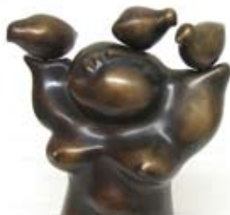
2 gold after, 23x16 cm, € 3100,-