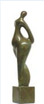
Toute en bonheur, 28x8 cm, Brons, € 750,-