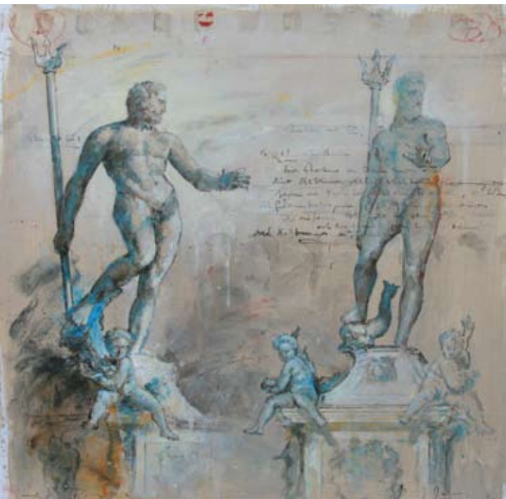
La fontana, Gem.techn/karton, 62x62 cm, € 2900,-