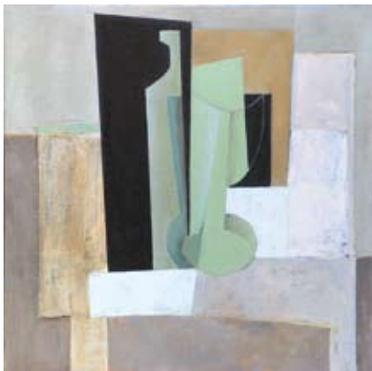
Hommage to Braque I, 40x40 cm, € 1100,-