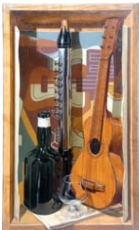
Retour à l'origine, 55x33 cm, € 5895,-