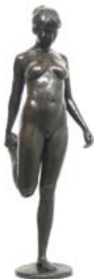
Stretching, 71 cm, € 3750,-