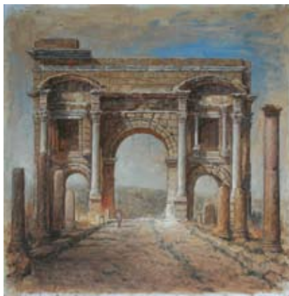
Arc, 120x120 cm, € 6500,-