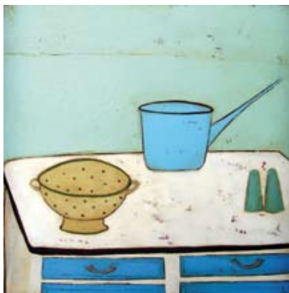
Boiled potatoes, Olieverf/linnen, 80x80 cm, € 1650,-