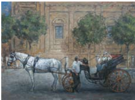
De koets, 60x80 cm, € 4500,-