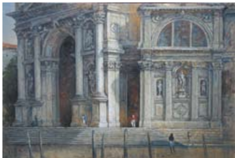
De facade, Olieverf/linnen, 100x150 cm, € 7500,-