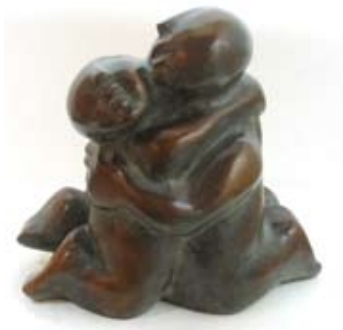
Rondeau, Brons, 29x27 cm, € 4775,-