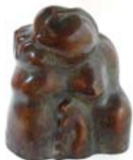
Gala, 22x16 cm, € 4775,-