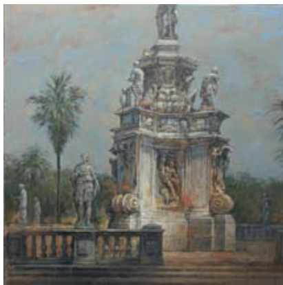
Il giardino, 120x120 cm, € 6500,-