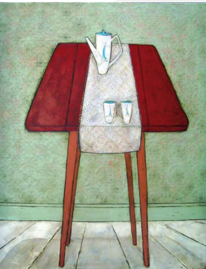
Tea for two, 150x120 cm, € 2990,-