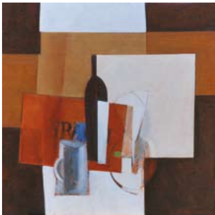
Hommage to Braque II, 40x40 cm, € 1100,-