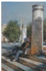
Touristen, 30x20 cm, € 1850,-