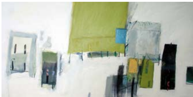
Blue Studebaker 59x122 cm, € 3250,-