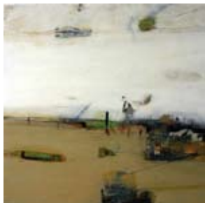
Solent Edge, 40x40cm, € 1450,-