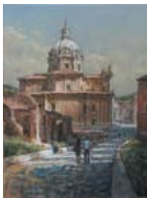
Roma, 35x27 cm, € 1950,-