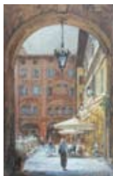
La porta, 30x18 cm, € 1950,-