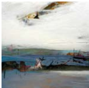
Briez Sea, 40x40 cm, € 1450,-