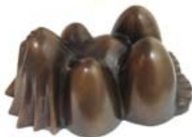
To.to., 36x21 cm, € 5975,-