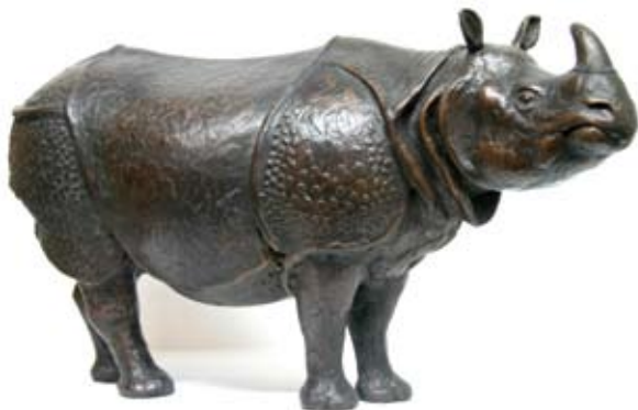
Neushoorn (Indische), Brons, 26x48 cm, € 2900,-