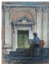
De krant, 35x27 cm, € 1950,-