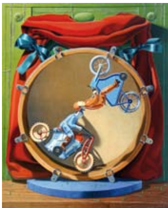
Circus no 2, 41x33 cm, € 3750,-