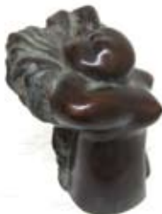
Valri, 20 cm, € 2400,-