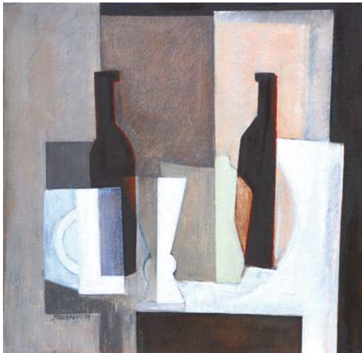
Stillife with bottles, glass and ginger jar, 40x40 cm, € 1100,-