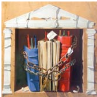
Fin d'une société idéale, 40x40 cm, € 5875,-