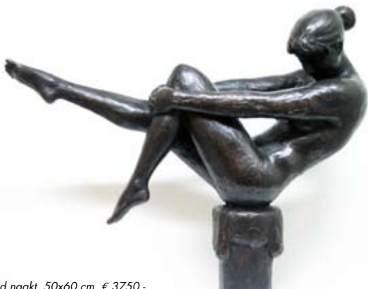
Zittend naakt, 50x60 cm, € 3750,-