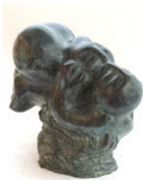
Compote, 24x30 cm, € 4775,-