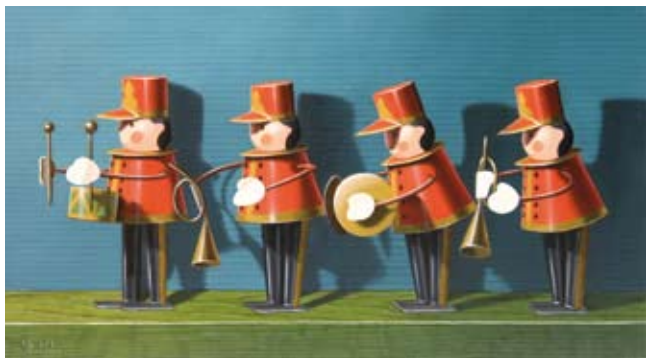
La Fanfare, Olieverf/linnen, 19x33 cm, € 2290,-