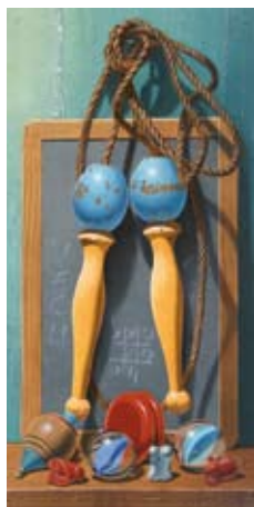
Récréation, 40x28 cm, € 2875,-