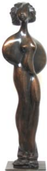
Woman in the wind, 75 cm, € 8350,-