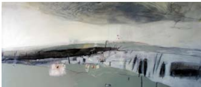
Swords at Camlan, Gem. Techn/paneel, 53x119 cm, € 2975