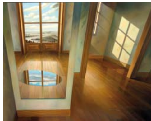
Confluences, 81x100 cm, € 15.500,-