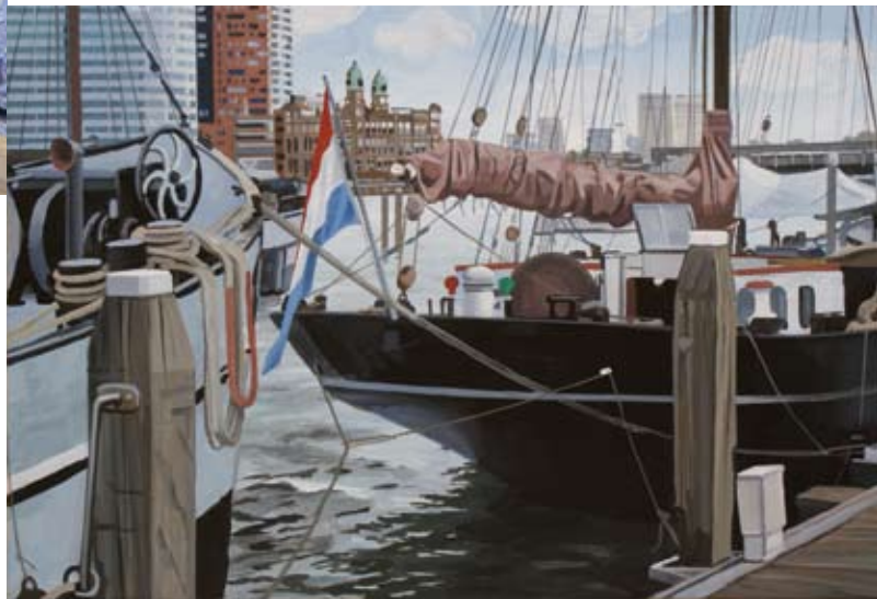
Veerhaven, 40x60 cm, € 1650,-