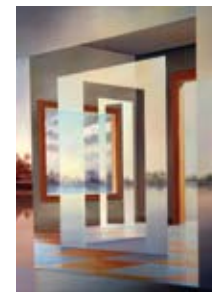
Viva el verano, 81x100 cm, € 15.500,-