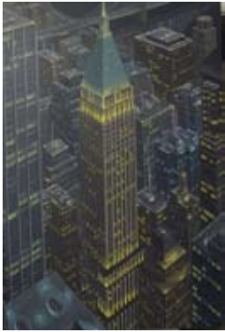
Night case, 195x150 cm, € 5900,-