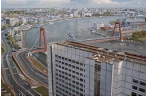
Willemsbrug, 40x60 cm, € 1650,-