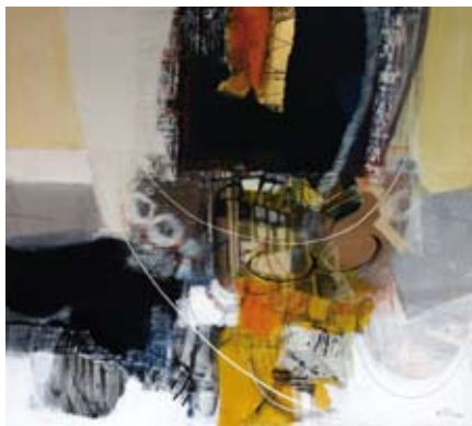
Challenge, 90x80cm, € 2250,-