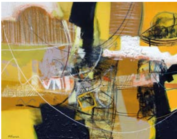
Summer time, 47x65 cm, € 1375,-