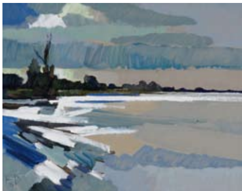
Oktober, Olieverf/paneel, 60x80 cm, € 2735,-

roepen associaties op met landschappen die de toeschouwer eerder gezien en ervaren heeft.