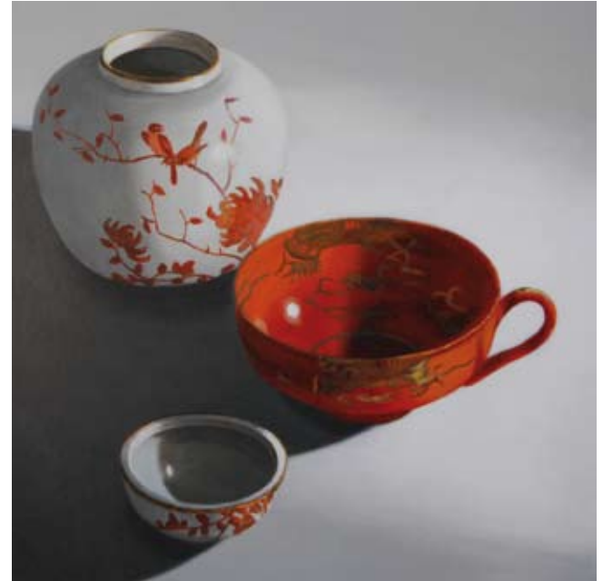
Witte pot met rode Chinese kop, 120x120cm, € 3400,-