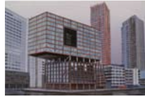
Red Apple, 40x60 cm, € 1650,-