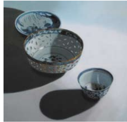
Chinese kommen in het licht, 120x120 cm, € 3400,-