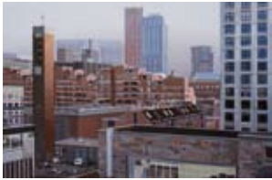
Red Apple en Watertoren, 40x60 cm, € 1650,-