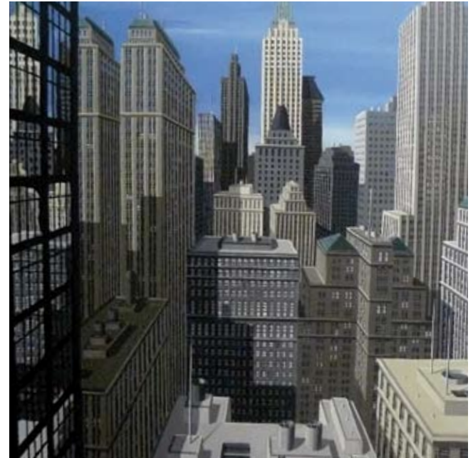
Chase Manhattan, 150x150 cm, € 5900,-