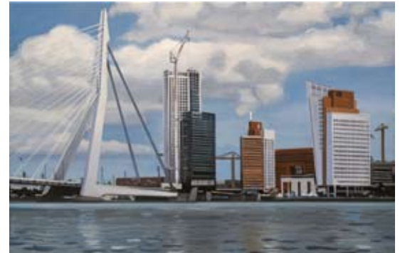
Maastoren, 40x60 cm, € 1650,-