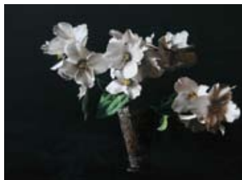
Boerenjasmijn II, Olieverf/paneel, 30x40 cm, € 2975,-