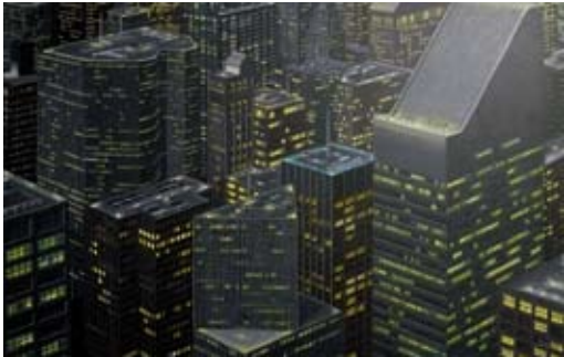
Night citicorp, 130x195 cm, € 5900,-