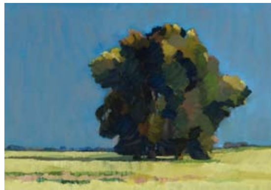
Laag licht, 60x80 cm, € 2735,-