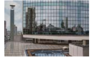
Beurs WTC gebouw, 40x60 cm, € 1650,-