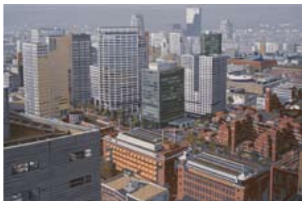
Coolingsingel-Lijnbaankwartier, Olieverf/linnen, 40x60 cm, € 1650,-