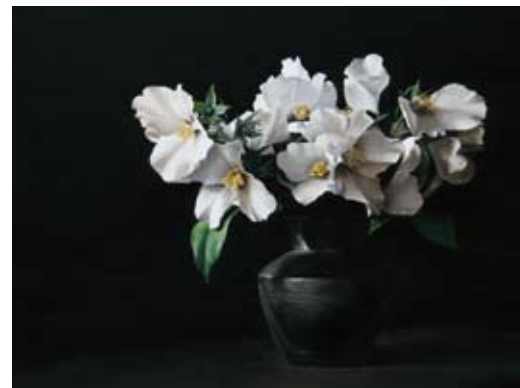
Boerenjasmijn I, 24x30 cm, € 2500,-