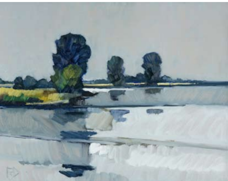
Zomerse stilte, Uitweg, 60x80 cm, € 2735,-