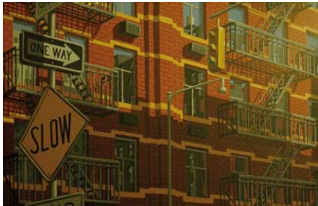
Slow, Acryl/linnen, 130x195 cm, € 5900,-