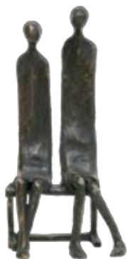
2 figuren op bankje, brons, 32 cm, € 1200,-