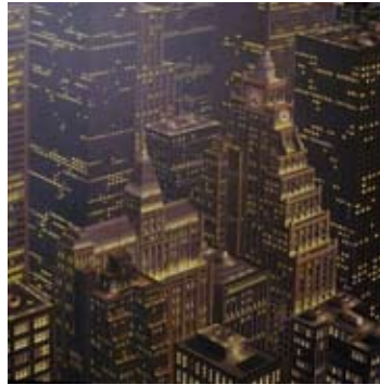
Hotel carter, 150x150 cm. € 5900,-