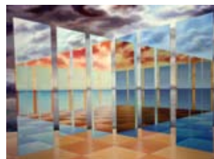
Labyrinthe cubique, 100x73 cm, € 14.500,-