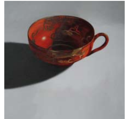
Chinese rode kom in het licht, 100x100 cm, € 3200,-