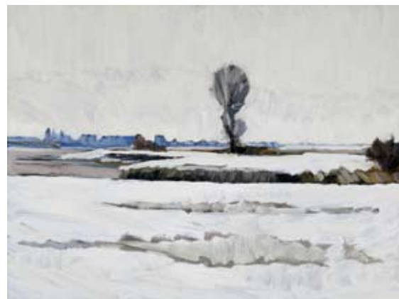
Sneeuw bij Jaarsveld, 60x80 cm, € 2735,-