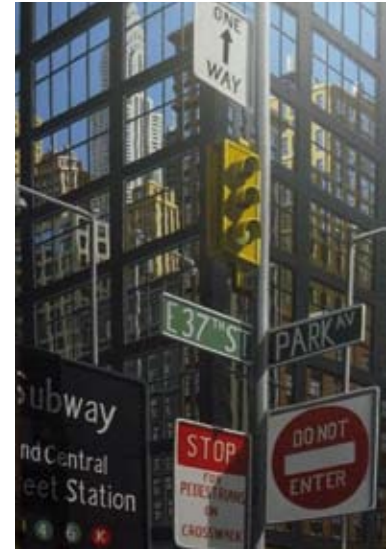
Park Avenue, 195x130 cm, € 5900,-