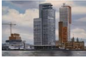
Kop van Zuid, 40x60 cm, € 1650,-