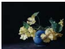
Gele Oost-Indische kers, 30x40 cm, € 2975,-