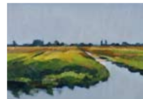
Bloeiend gras, 60x80 cm, € 2735,-