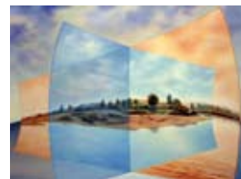
Equilibre, 65x81 cm, € 8500,-