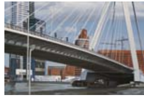
Erasmusbrug, 40x60 cm, € 1650,-