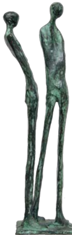
2 staande figuren, 38 cm, € 1100,-