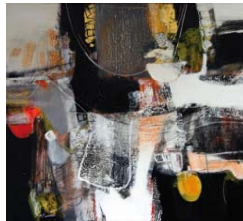
Change, 90x100, € 2275,-