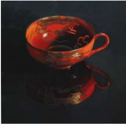
26 Chinese rode kop in het donker, 100x100 cm, € 3200,-