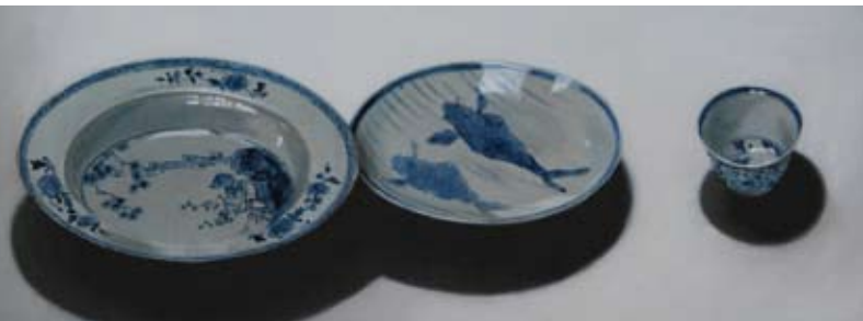
Chinese bordjes in het licht, Acryl/linnen, 60x160 cm, € 3200,-