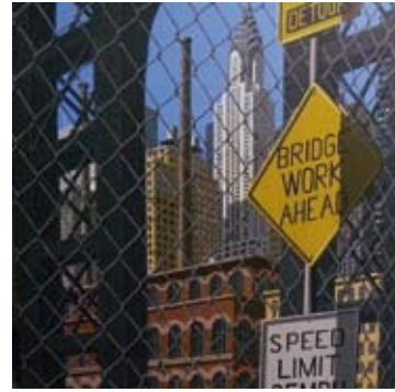
Bridge work, 150x150 cm, € 5900,-