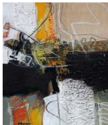
Go far I, 45x40 cm, € 800,-