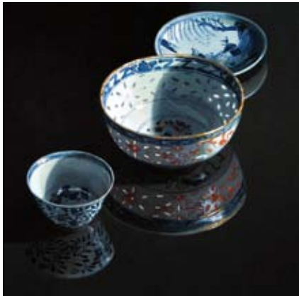
Chinese bakjes in het donker gespiegeld, 120x120 cm € 3400,-