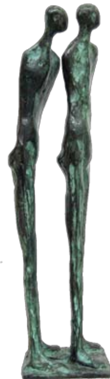
2 figuren, 37 cm, € 1100,-