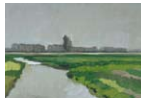
Nescio, 60x80 cm, € 2735,-