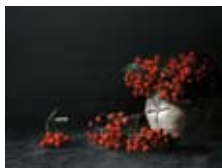
Rode bessen, 30x40 cm, € 2975,-