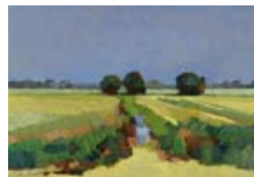
Polder Middelbroek, 60x80 cm, € 2735,-