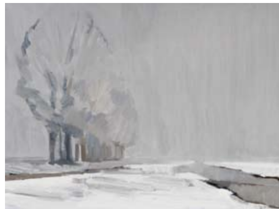
Sneeuw bij Langerak, 60x80 cm, € 2735,-