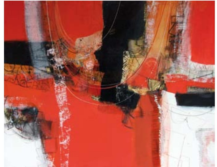
Be our selfs, 80x100 cm, € 2150,-