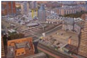
Laurenskwartier, 40x60 cm, € 1650,-