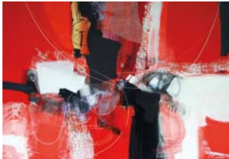
Wild lands, Gem. Techniek/linnen, 80x100 cm, € 2150,-