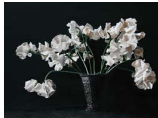
Witte Lathyrus, 30x40 cm, € 2975,-