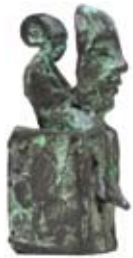
Persona , 12 cm, € 675,-