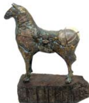
Equus 2, Unicum, 21 cm, € 2150,-