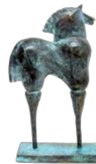
Naima, 35 cm, € 2150,-