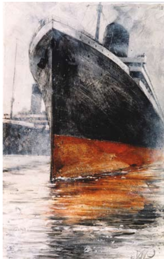
Arrivée aux Tilbury docks, 35 x 22 cm, € 595,-