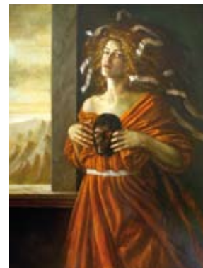
Deepest me, 80 x 60 cm, € 5250,-