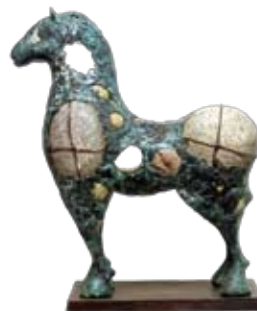
Equus, Unicum 49 cm, € 5500,-