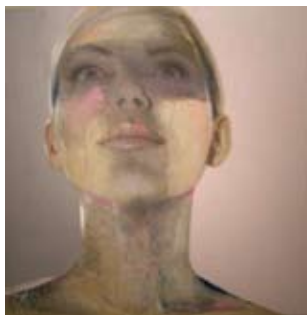
Contemplation, 60 x 60 cm, € 2125,-