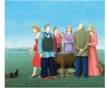
Draaitafel, 53 x 60 cm, € 2400,-