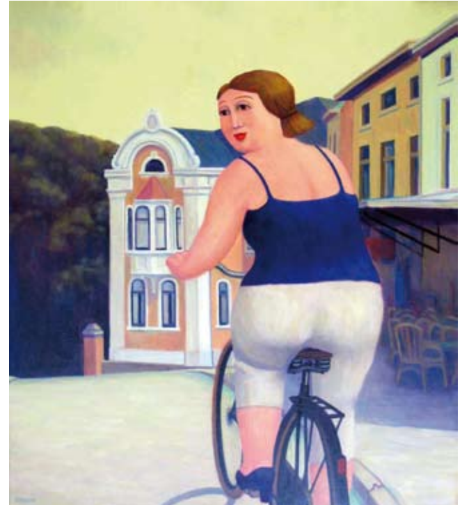
Op de Fiets, 85x75 cm, € 3950,-