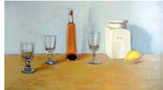
Honey liqueur, 60 x 100 cm