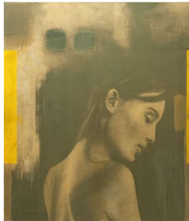
Madonna, 115 x 100 cm, € 3600,-