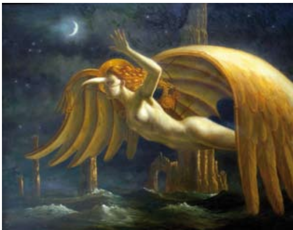
Dreamflight, 70 x 90 cm, € 5900,-