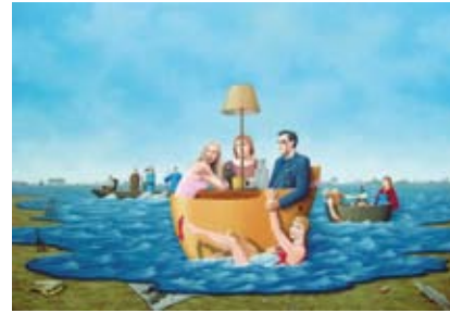
Gevolgen van de zondvloed II, 100 x 150 cm, € 9750,-