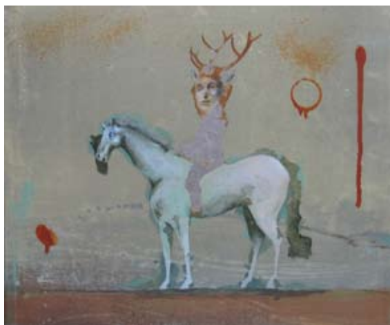
Shaman, 30 x 35 cm, € 975,-