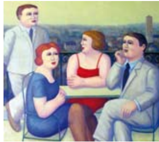
Wachten op een balkon, 80 x 90 cm, € 4350,-