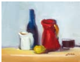
14 x 18 cm