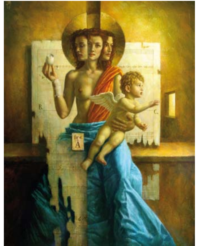
What is what was and what will be , 90 x 70 cm, € 5900,-