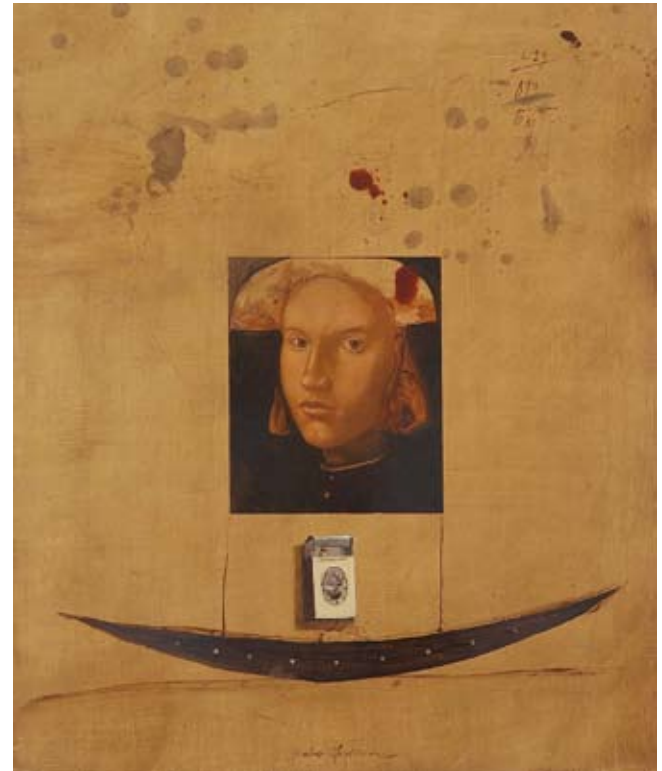
Sifna, 72 x 60 cm, € 4590,-