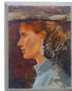
Portret 12, 20 x 15 cm, € 895,-