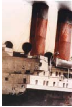
Deux cheminées, 120 x 80 cm, € 4100,-