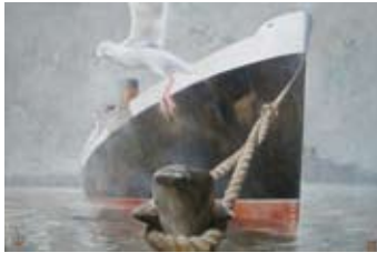
L'envol, 100 x 150 cm, € 4525,-