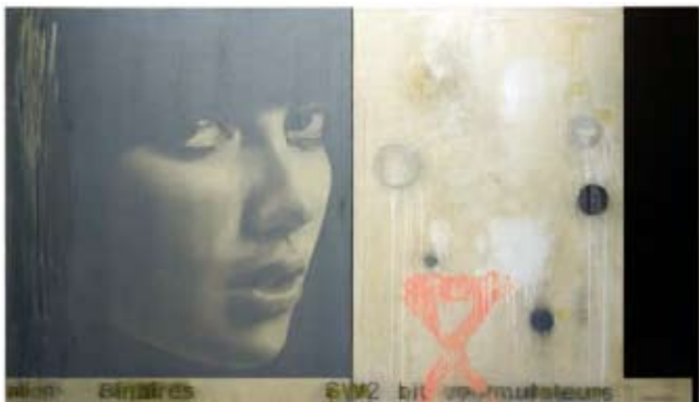
Madonna, 115 x 200 cm, € 6650,-