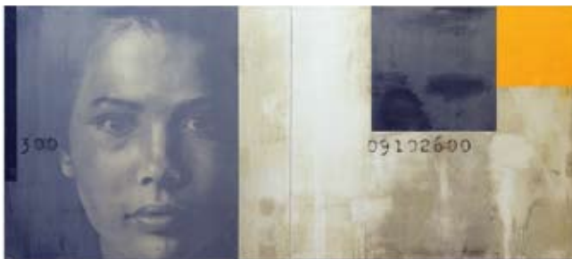
Madonna, 80 x 180 cm, € 4975,-