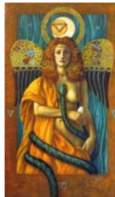
Venus serpentis, 60 x 30 cm, € 2250,-