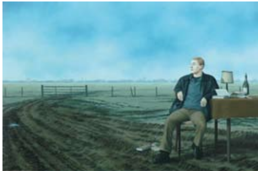
Wachten, 40 x 60 cm, € 2300,-