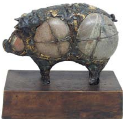
Porcellus2, Unicum, 17 cm, € 1950,-