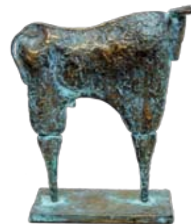
Toro, 28 cm, € 2150,-