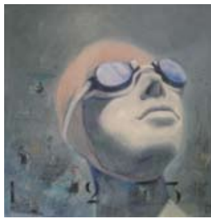
Ageuse, 100 x 100 cm, € 4100,-