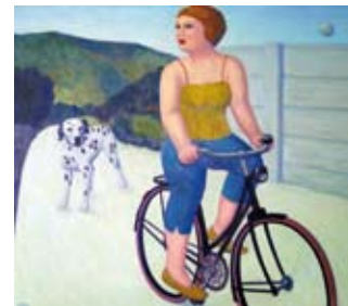
Verstilt landschap, 100 x 115 cm, € 4775,-