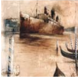
Venise, 70 x 70 cm, € 2175,-