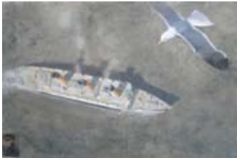
Survol, 100 x 150 cm, € 4525,-