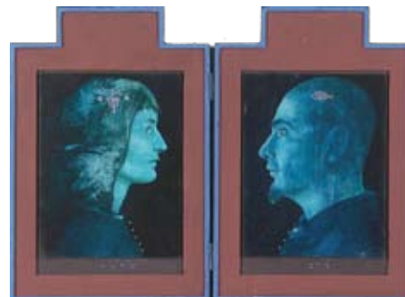
Couple, 40 x 50 cm, € 3975,-