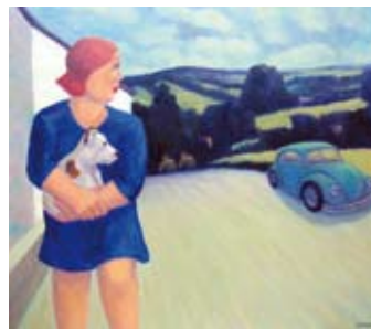
Meisje bij witte huis, 70 x 80 cm, € 3650,-