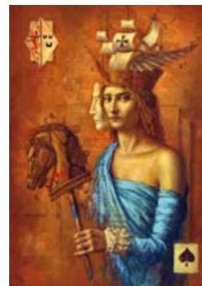
The Eve of Balthaz, 70 x 50 cm, € 3950,-