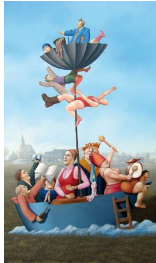
Het narrenschip, 90 x 53 cm, € 3250,-