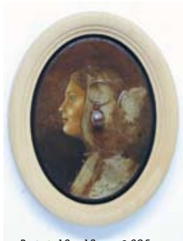
Portret, 18 x 13 cm, € 895,-