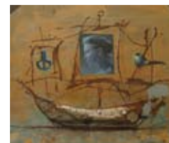
Ship, 61 x 51 cm, € 4500,-