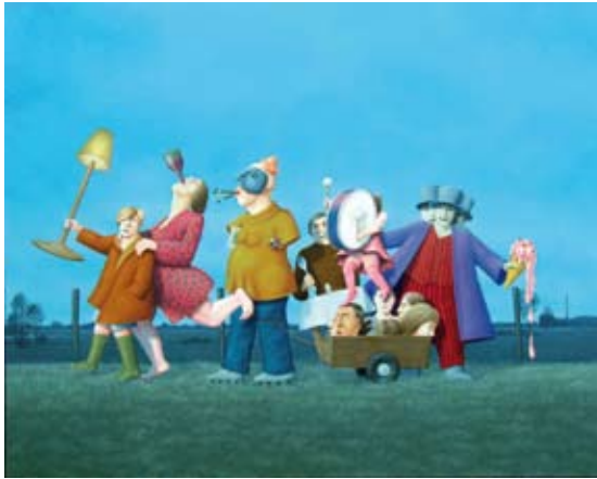
Feest op de dijk, 94 x 120 cm, € 5750,-