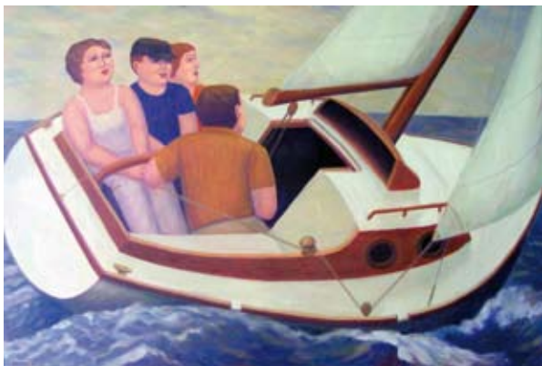
Sailing, 100 x 150 cm, € 6500,-