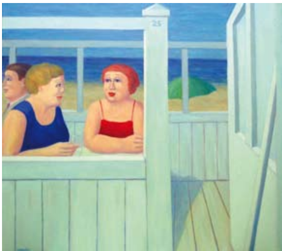
Voorjaar aan zee, 80 x 90 cm, € 4350,-