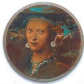
Portret 14, 22 cm, € 895,-