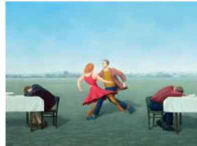
Poging tot symmetrie, 60 x 90 cm, € 3250,-