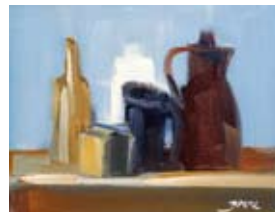
14 x 18 cm