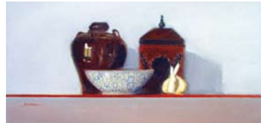
Chinese bottle and bowl, 40 x 80 cm