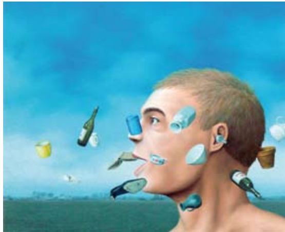
De verteller, niet het verhaal, 52 x 60 cm, € 2400,-