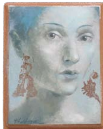
Portret 13, 20 x 15 cm, € 895,-