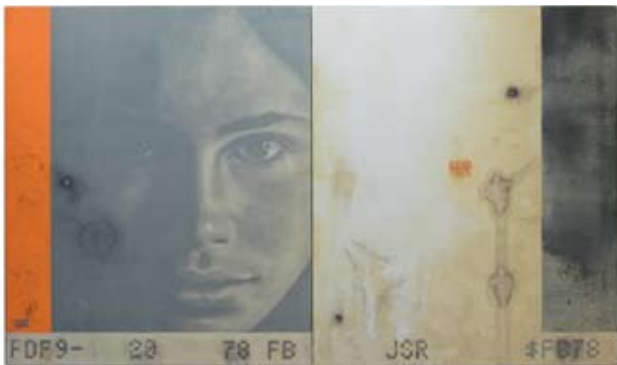
Madonna, 80 x 180 cm, € 4975,-