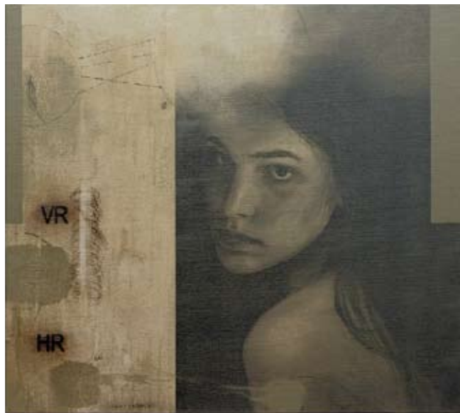
Madonna, 80 x 90 cm, € 2975,-