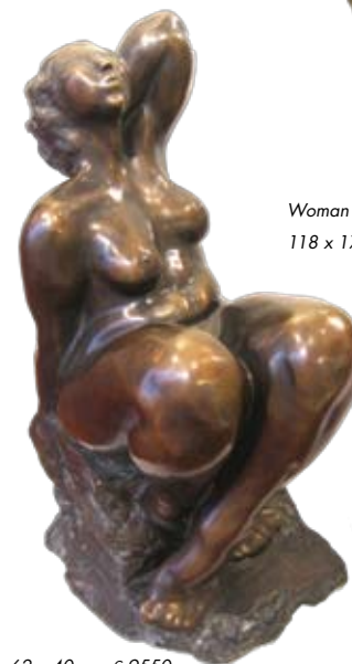
Madame de Pompadour, 62 x 40 cm, € 9550,-