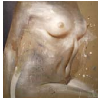
Buste, 50 x 50 cm, € 1675,-