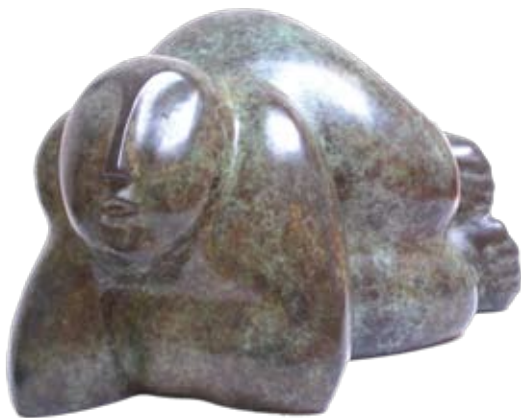
Maya, 23 x 40 cm, € 7650,-