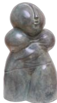
Woman in blue, 52 x 25 cm, € 7650,-