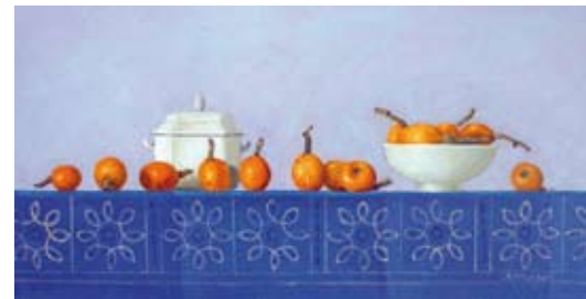
Nisperos, 40 x 80 cm