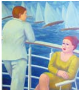
Aan de railing, 80 x 70 cm, € 3650,-