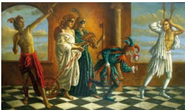
The Rite, 65 x 110 cm, € 6500,-