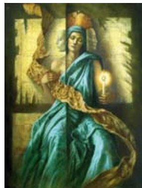
There are two lights, 90 x 70 cm, € 5900,-