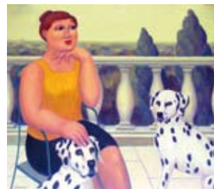
Terras met dalmatiërs, 60 x 70 cm, € 3400,-