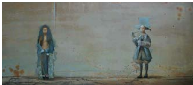
Couple, 60 x 105 cm, € 9550,-