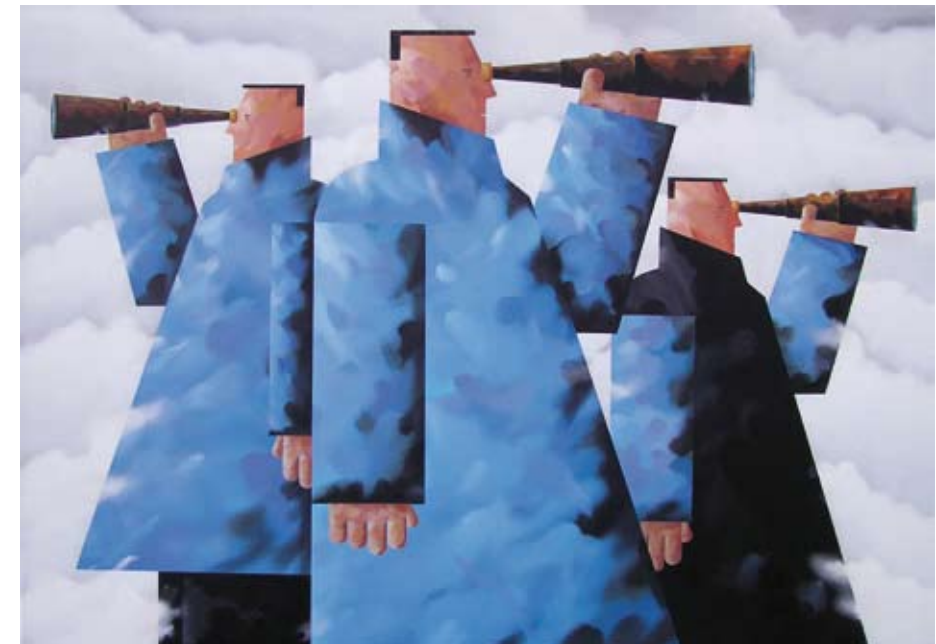
Kijkers, 100 x 140 cm, € 3900,-