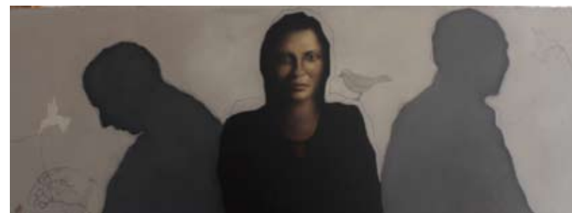
Tussen die hier en die nou, 45 x 120 cm, € 5650,-