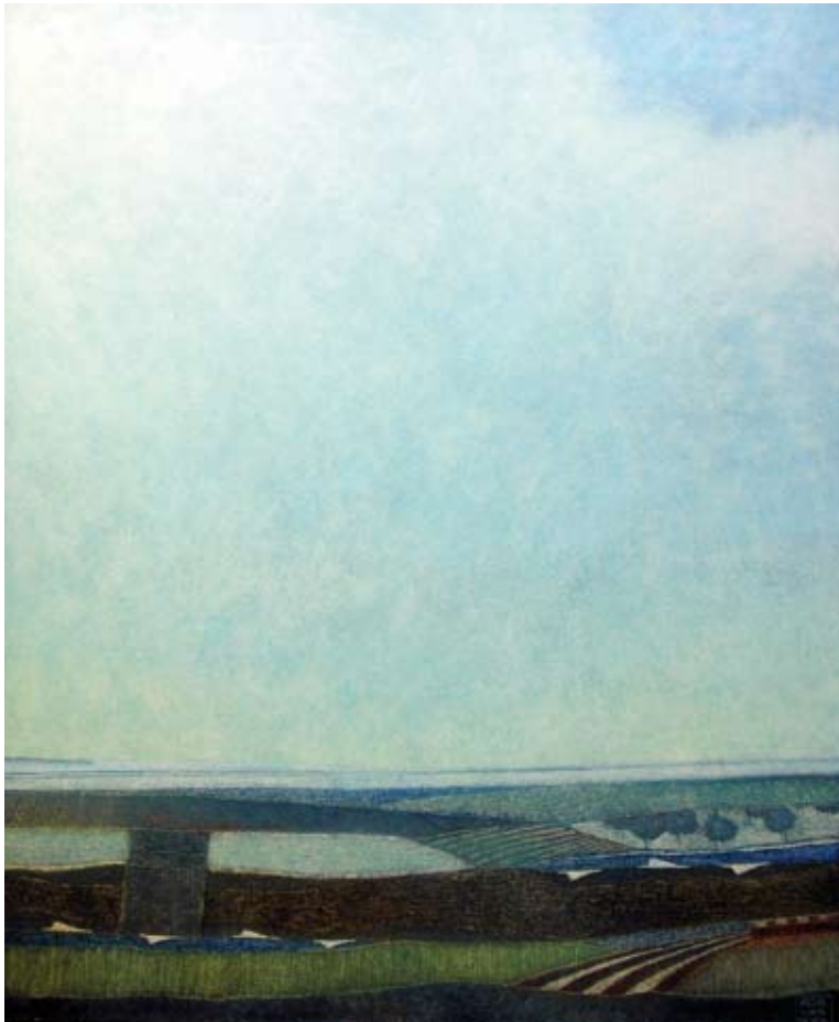
Time waits for me, olieverf op linnen, 120 x 100 cm, € 2375,-