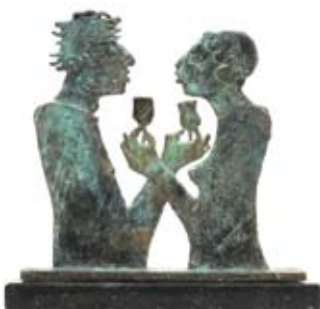
De liefde tussen jou en mij is als een libel, 19 x 20 cm, € 1260,-