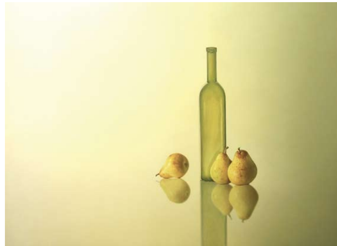
90 x 120 cm, € 5500,-