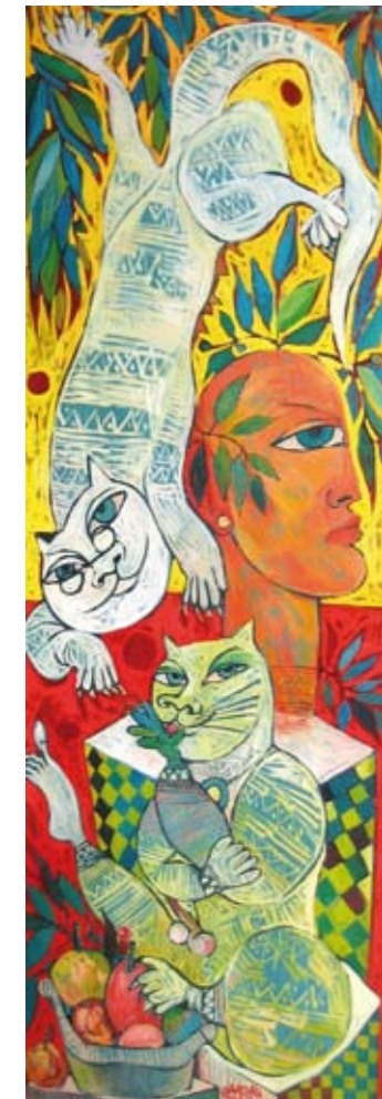
Mis gatos me explican, 150 x 50 cm, € 2250,-