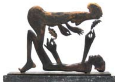
Plume II, 21 x 29 cm, € 1260,-