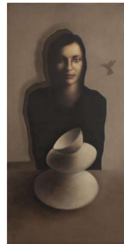
Verbeeldingsvlug, 100 x 50 cm, € 4950,-