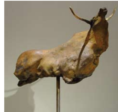
Longhorn IV, brons 16 x 23 cm, € 1750,-