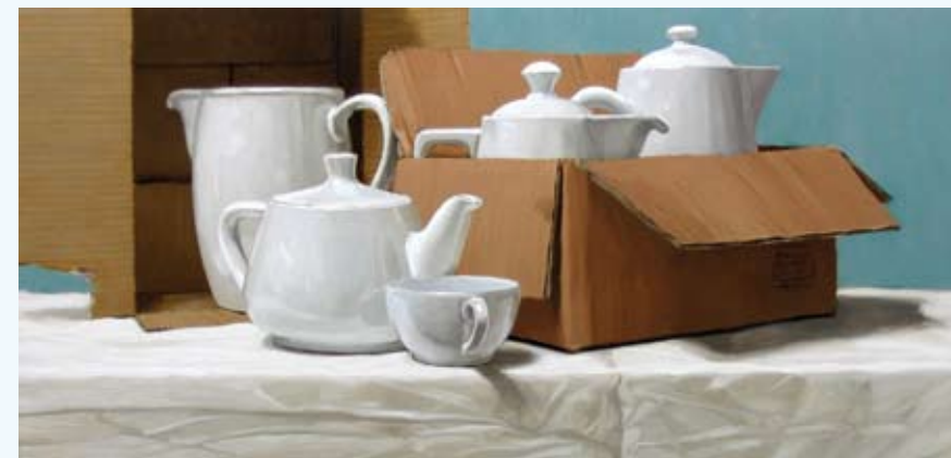
Paolo Quaresima, Cartoni, olieverf op paneel, 30 x 63 cm, € 2975,-