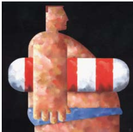
Ziezo en nu naar een zwembad, 35 x 35 cm, € 975,-