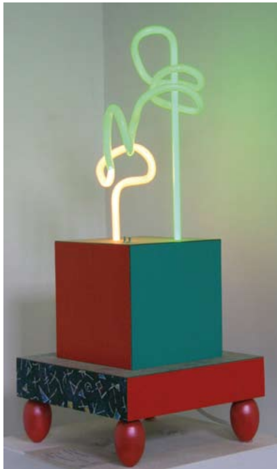
Neon, 45 cm, € 995,-