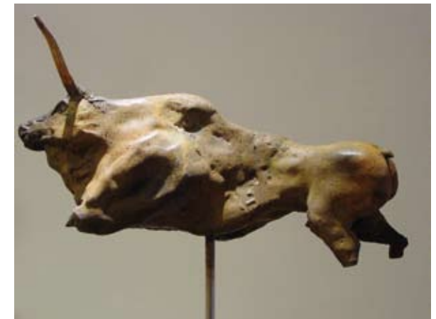
Longhorn II, brons 18 x 35 cm, € 1750,-