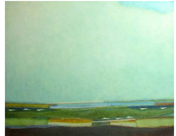
When springtime rivers flow, 60 x 80 cm, € 1900,-