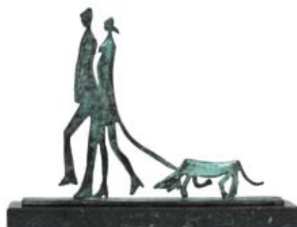
Slenteren door een bochtige straat, 17 x 24 cm, € 990,-