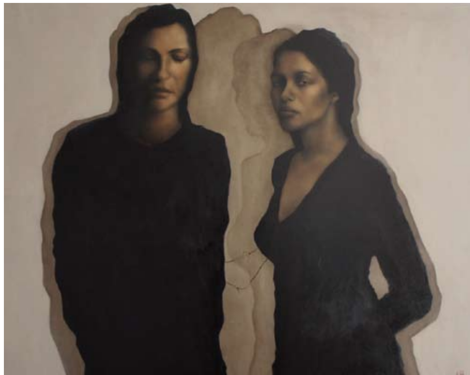
Ek ken haar, olieverf op paneel, 90 x 120 cm, € 7800,-