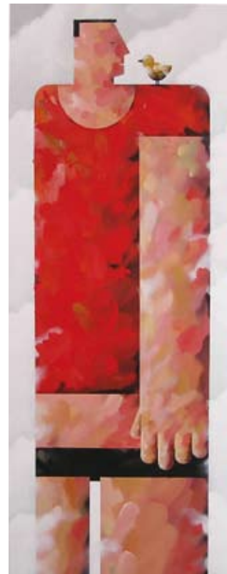
Aangenaam kennis te maken, 100 x 40 cm, € 2900,-