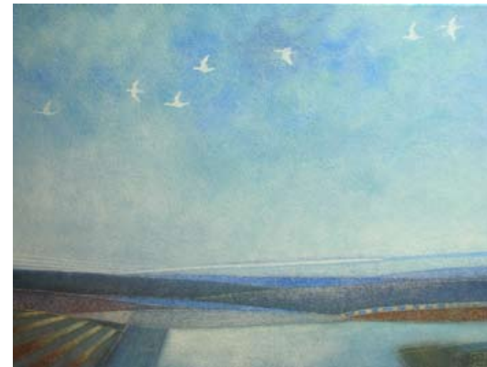
Sweet wind we must borrow, 60 x 80 cm, € 1900,-