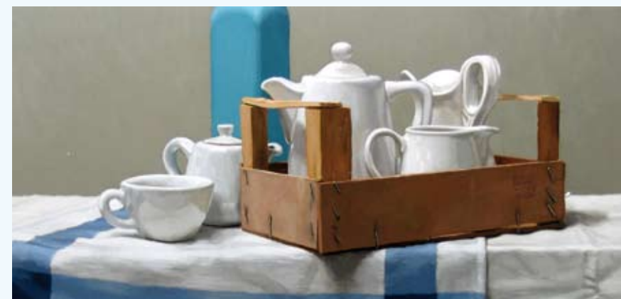
Paolo Quaresima, Cassettina, 30 x 63 cm, € 2975,-

LUNCH | DINER | PARTIJEN | VERGADERINGEN