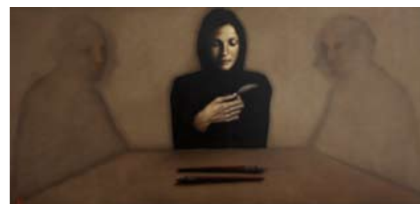
Muse 1&2, 60 x 120 cm, € 6200,-