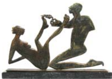
Plume I, brons, 21 x 30 cm, € 1260,-