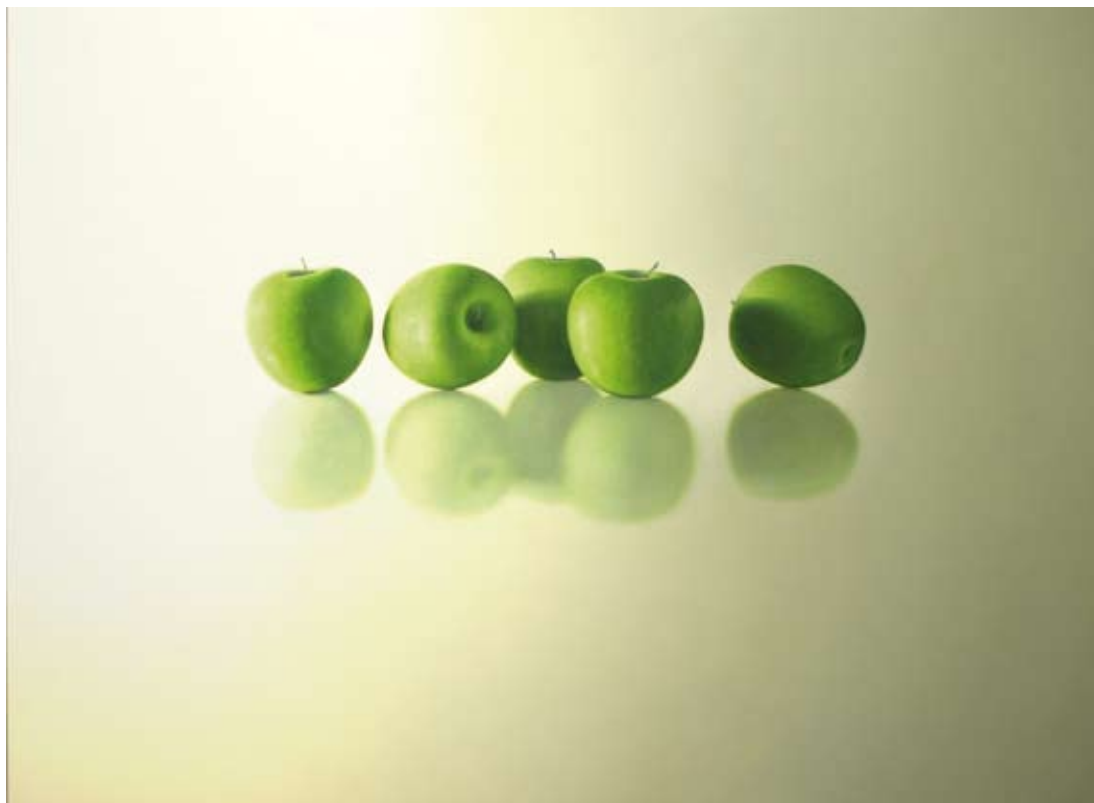
Olieverf op paneel, 80 x 120 cm, € 5500,-