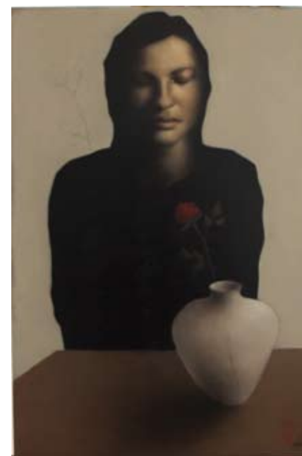
Uit my tuin, 60 x 40 cm, € 3675,-