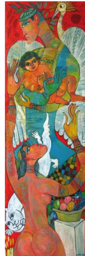
Nuestra familia, olieverf op linnen, 150 x 50 cm, € 2250,-