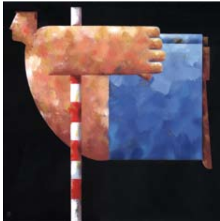
Acrobaat, olieverf op linnen, 35 x 35 cm, € 975,-