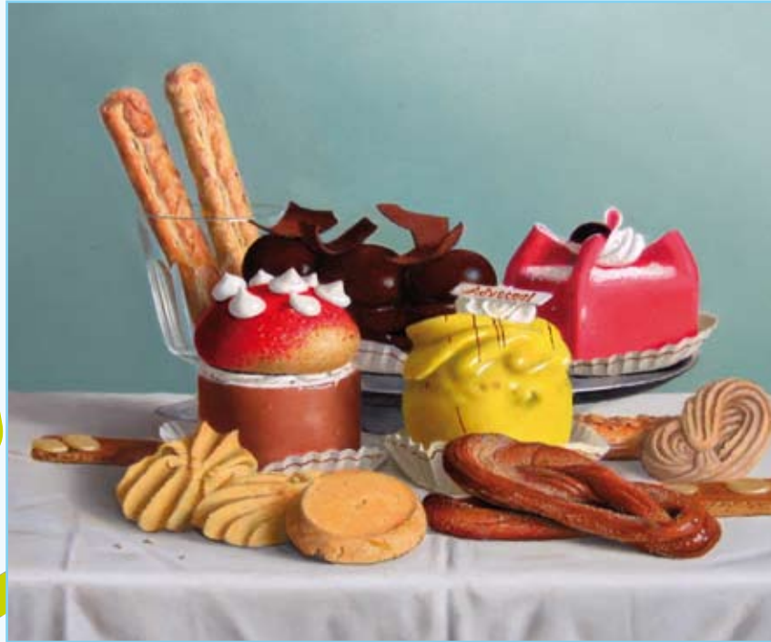
Klaas Wiedijk, olieverf op paneel, 25 x 30 cm, € 1975,-

'Het Heden' is een restaurant met ca. 110 zitplaatsen binnen en ca. 120 zitplaatsen buiten in onze tuin.