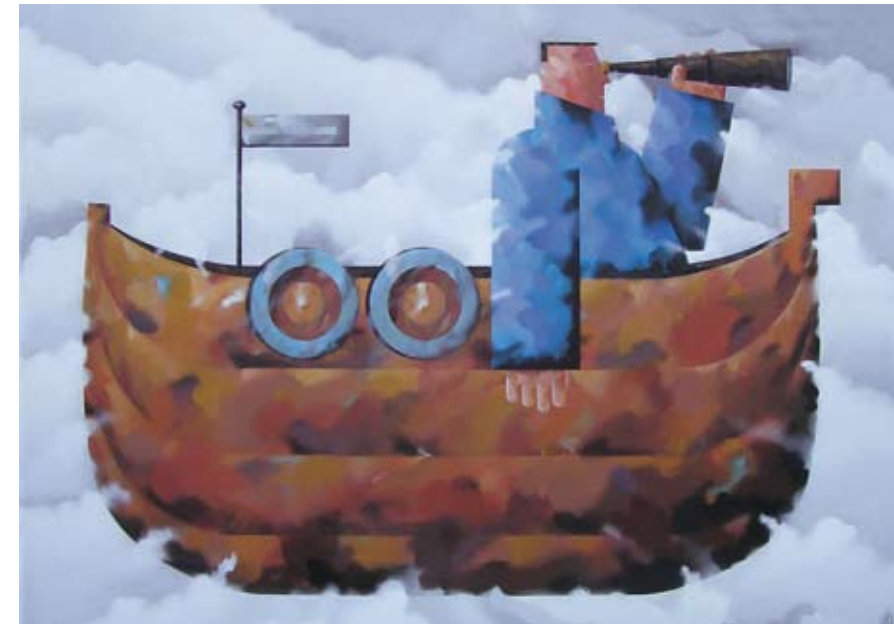
Luchtruimverkenner, 100 x 140 cm, € 3900,-