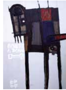
70x50 cm, € 1550,-