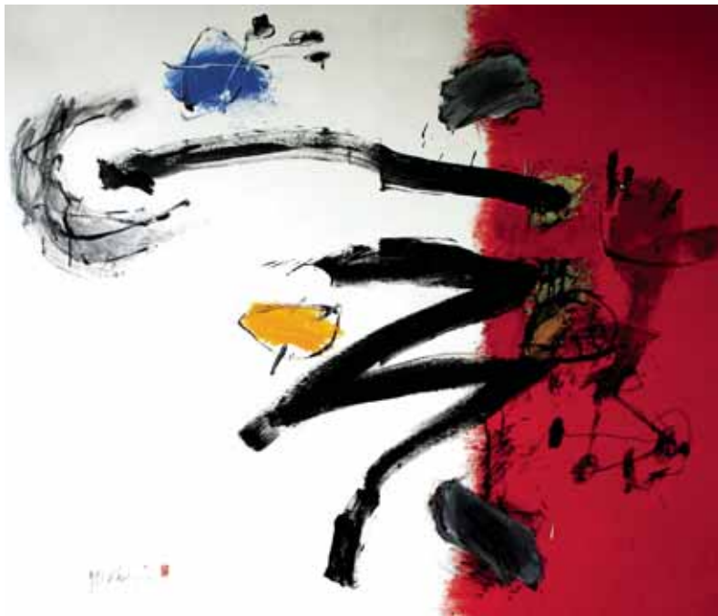
Z.t., olieverf/linnen, 120x140cm, € 6000,-