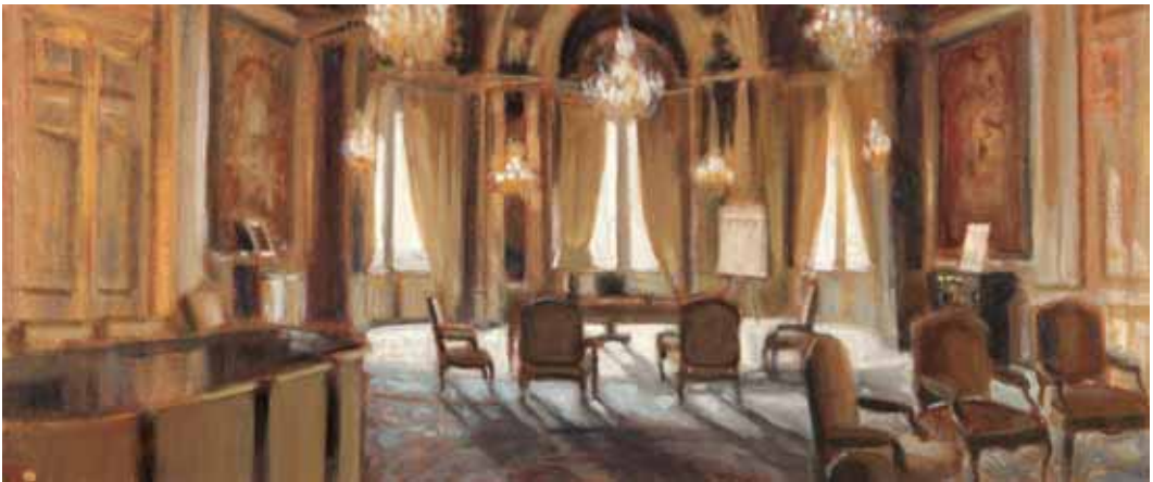
Hoge heren, olieverf/linnen, 30x70 cm, € 2860,-