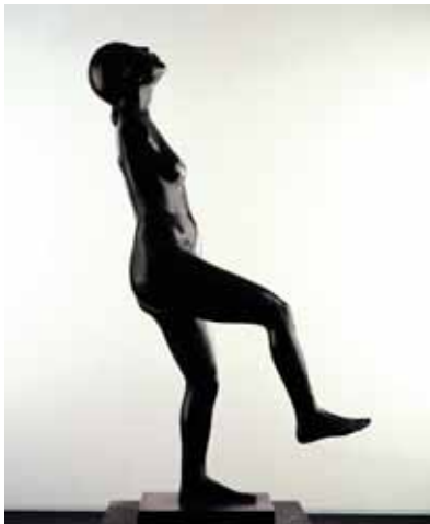
Walk, 145cm, € 17.000,-