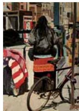
Canal Street, 40x30cm, € 975,-