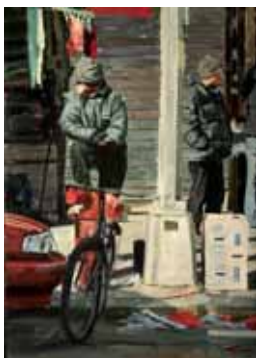
Home sweet home, 40x30cm, € 975,-