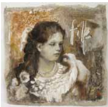
Portret in opdracht, 35x35 cm, € 975,- excl. lijst.