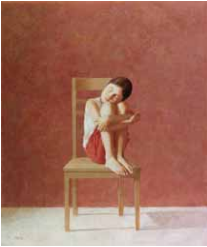
Middaglicht, 130x110, € 11000,-