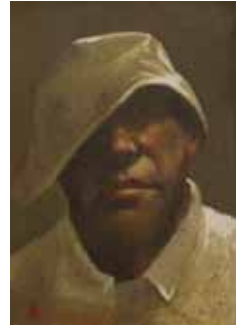
Floppy hat, 12x17cm, € 2350,-