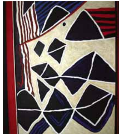
At the bend of the boyne, 126x112cm, € 7750,-