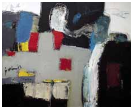
Piso Piso, 50x60cm, € 2250,-