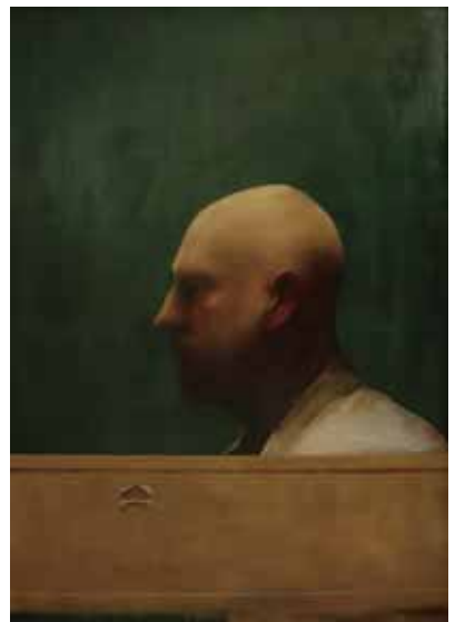
Smoothie, 82x58 cm, € 19.750,-