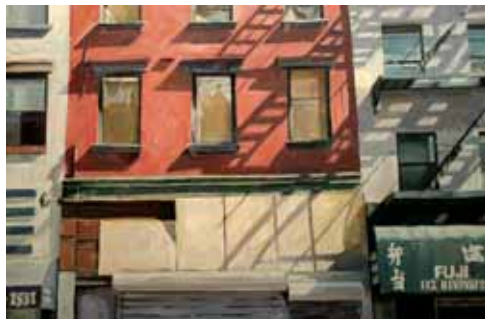
Rivington Street Blues, 60x90 cm, € 4690,-