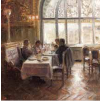
Train Bleu serie, 50x50 cm, € 3335,-