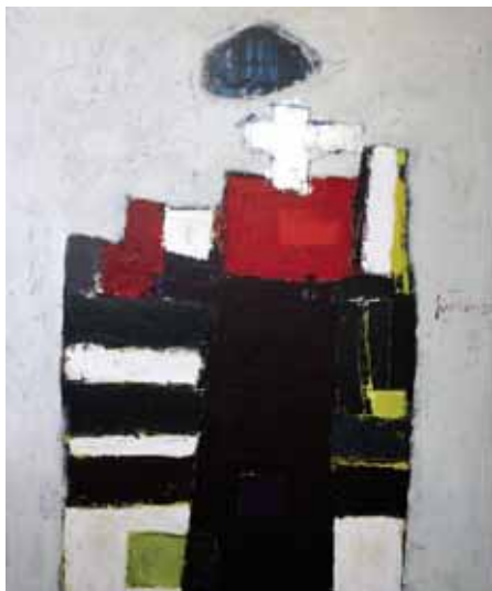
Kathedraal, 120x100cm, € 5000,-