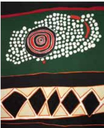
Beyond high banks, 91x76cm, € 3900,-