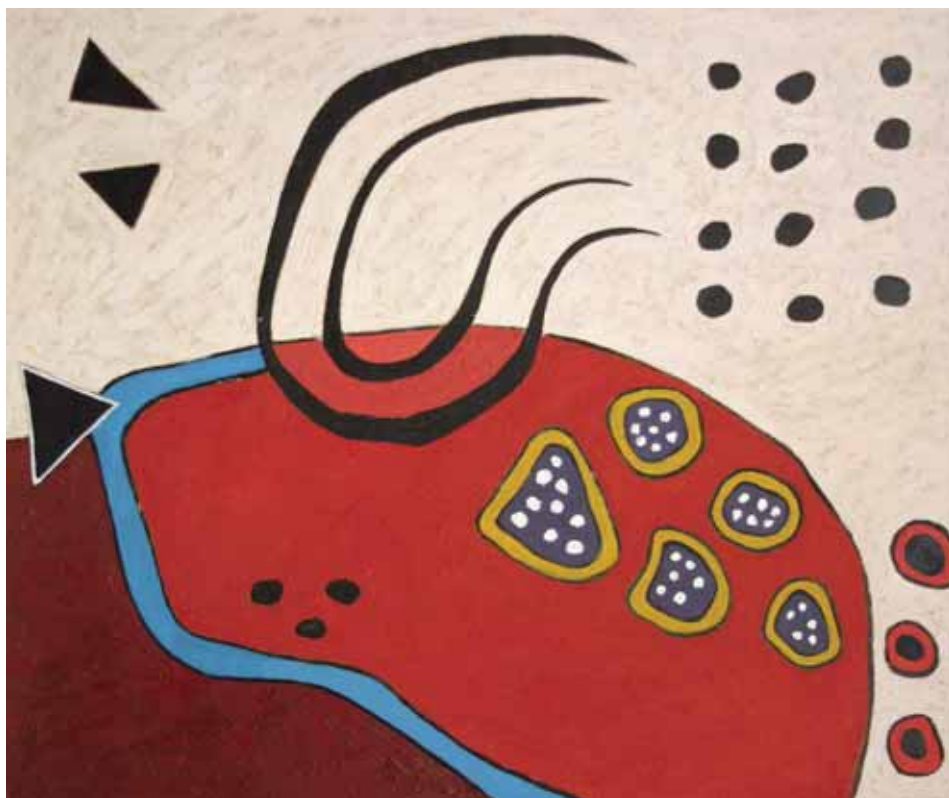
Kandinland, olieverf/linnen, 51x61cm, € 2500,-