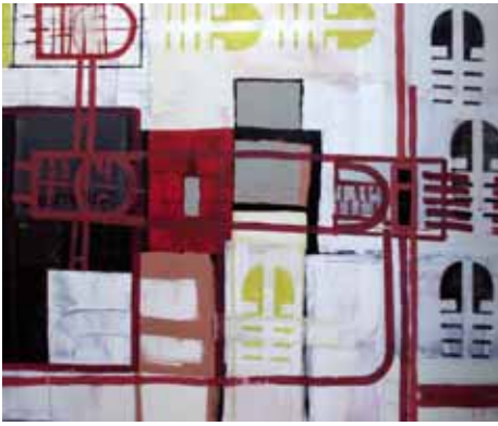
100x120 cm, € 2750,-