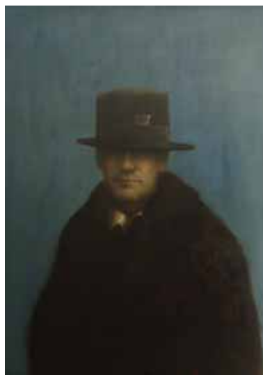
North Laines, 78x55cm, € 18.500,-