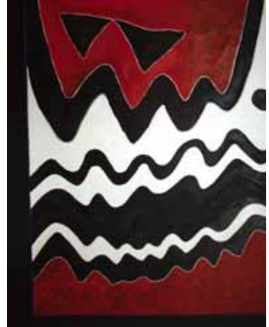
S. an Bhru, 126x101cm, € 7750,-