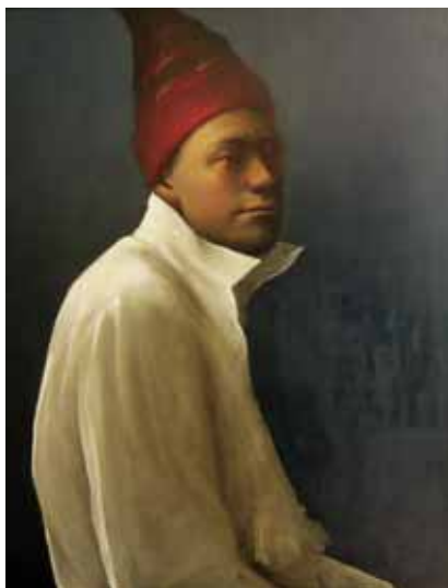
A hat for all occasions, olieverf/paneel, 80x62cm, € 19.750,-

Op klein formaat weet Hendley indringende portretten neer te zetten. Tegen een donkere achtergrond in diepe bruinen lichten zijn personages op, waardoor een intieme sfeer ontstaat. De zorgvuldig doorgewerkte beelden van één of meerdere gezichten - meestal van mannen - getuigen van een uitzonderlijke aandacht voor techniek en verfbehandeling. Hendley "steelt" vervliegende ogenblikken uit het leven van onbekenden op straat, of een andere openbare ruimte, om deze vervolgens in zijn atelier met de grootste toewijding te vereeuwigen.