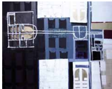
90x110 cm, € 2500,-