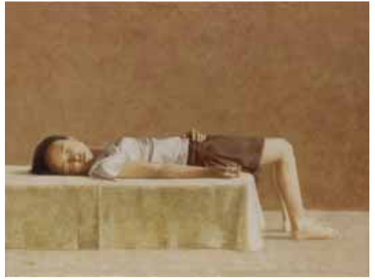
Puberteit, 85x120, € 9000,-