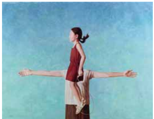
Springen, 140cmx180cm, € 16000,-