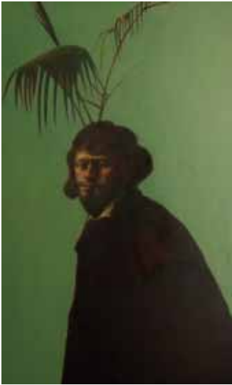
Mackintosh, 82x134cm, € 29.500,-