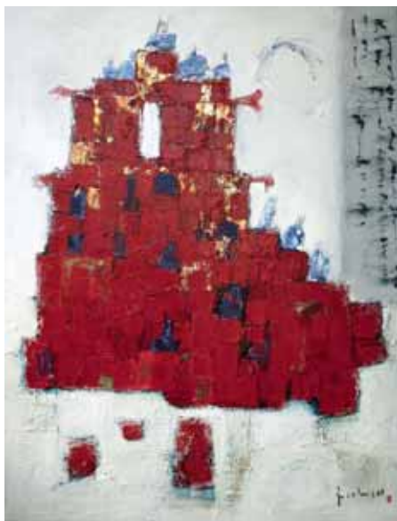
Z.t., 130x100cm, € 5000,-