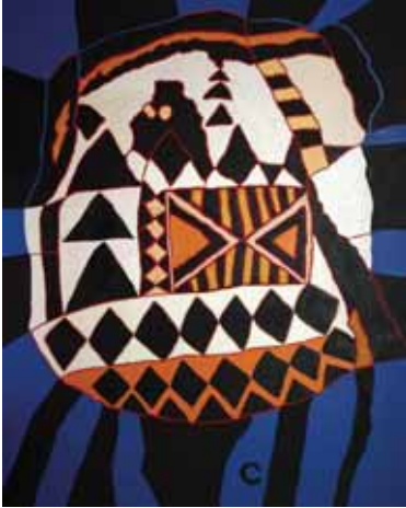
Peterstone, 126x101cm, € 7750,-