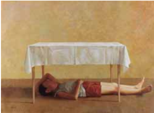
Gedekte tafel, 100x140, € 11000,-