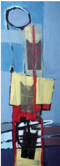
80x30 cm, € 1250,-