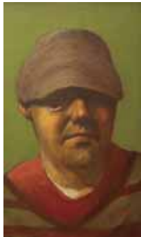
Brighton Beach, 13x21cm, € 2650,-