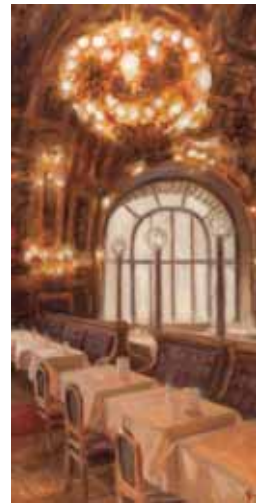
Train Bleu serie, 80x40 cm, € 3575,-