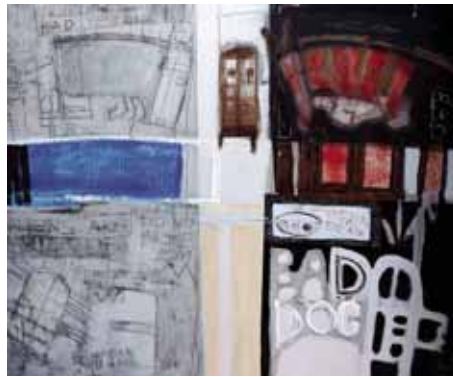
100x120 cm, € 2750,-