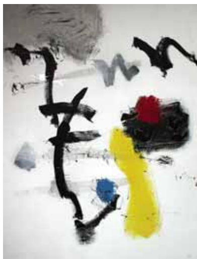
Z.t., 130x100cm, € 5000,-