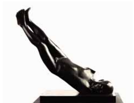
Falling, 70cm, € 8.400,-