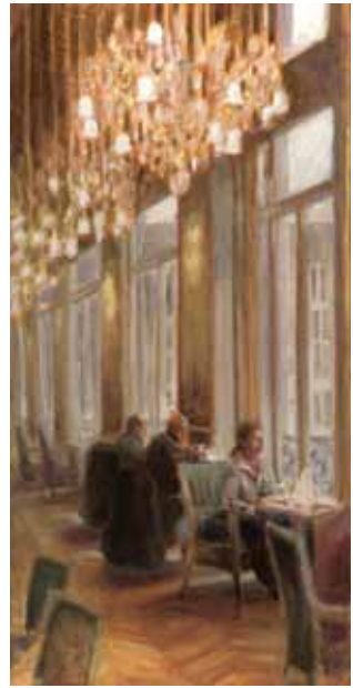
Café d'Orsay, 100x50 cm, € 3975