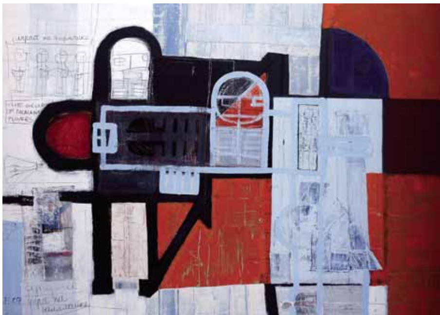
Olieverf/linnen, 100x140 cm, € 2975,-