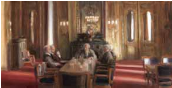
Vergadering in de Witte, 30x60 cm, € 2750,-