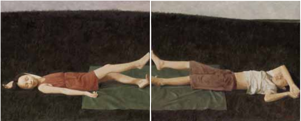
Grasveld, 2 luik, olieverf/linnen, 90x220, € 15000,-