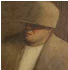
Round head, 11x11cm, € 1975,-