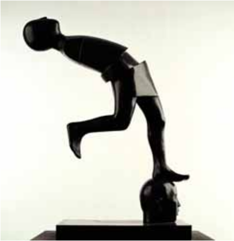
Step, brons, 80cm, € 8400,-