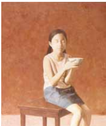
Water 1 (meisje), 95x80, € 7000,-