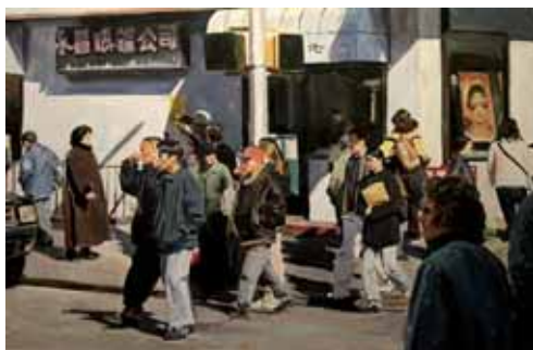
Street corner, olieverf/linnen, 60x90 cm, € 4690